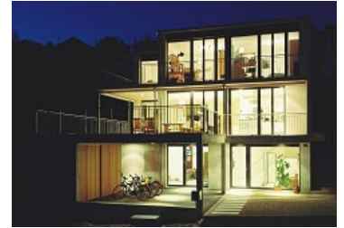
Neubau EFH Kienbergweg Sissach