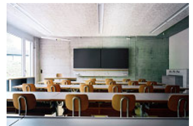
Neubau Schule und Sporthalle Gelterkinder