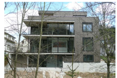
Neubau MFH Bützenenweg Sissach