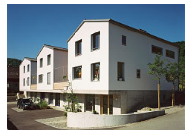
Neubau 3 EFH Moosackerweg Zunzgen