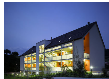
Neubau Alterswohnungen Diegten