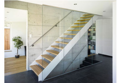
Neubau EFH In der Hegi Diegten