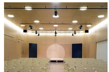
Umbau Bohryhaus Gemeinde Zunzgen