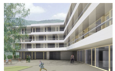
Wettbewerb - Neubau Altersheim Mühlmatt Sissach