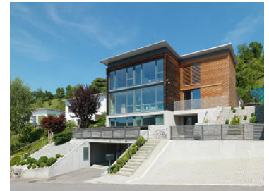
Anbau EFH Sonnhaldenweg Sissach