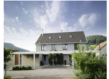
Neubau EFH am Bündtenweg Zunzgen