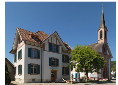
Umbau Pfarramt Katholische Kirche Sissach