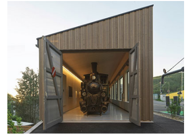
Neubau Remise Waldenburgerli Bubendorf