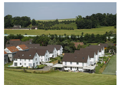
Wohnüberbauung 18 EFH Wiesenstrasse Diegten