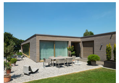
Neubau EFH Nettenbergweg Hochwald