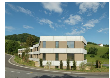
Neubau 2 MFH Rheinfelderstrasse 76 + 78 Sissach