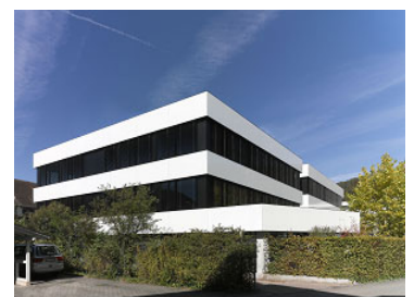
Sanierung Fassade / Räume KV Baselland Liestal