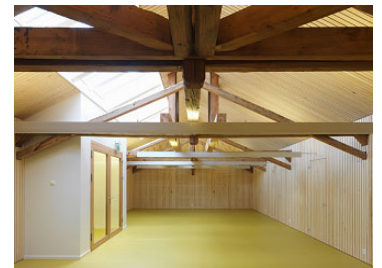
Sanierung Schulhaus Wenslingerstrasse Zeglingen