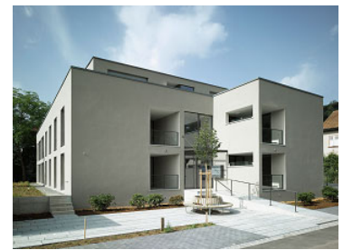
Neubau MFH Ebenrainweg Sissach