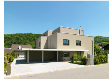
Neubau DEFH Steinenweg Zunzgen