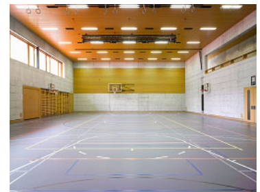
Neubau Mehrzweckhalle Zeglingen