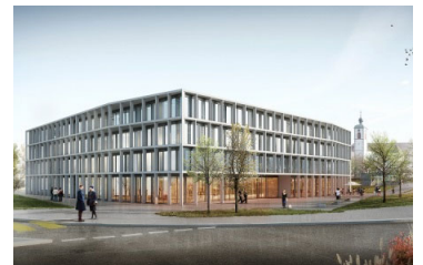
Wettbewerb - Neubau Stadthaus Kreuzlingen