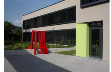
Umnutzung Turnhalle Hofmatt Gelterkinden