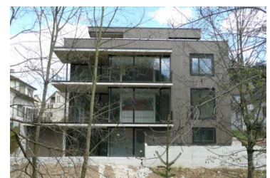
Neubau MFH Bützenenweg Sissach