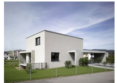
Neubau EFH Bielackerstrasse Gretzenbach