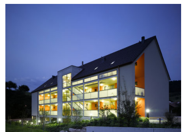
Neubau Alterswohnungen Diegten