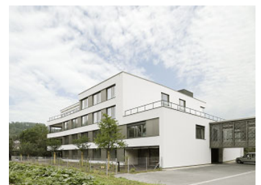
Erweiterung Zentrum Ergolz Ormalingen