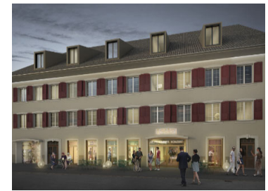
Umbau Marabu Gelterkinder