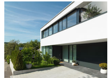
Neubau EFH Rebacher Diegten